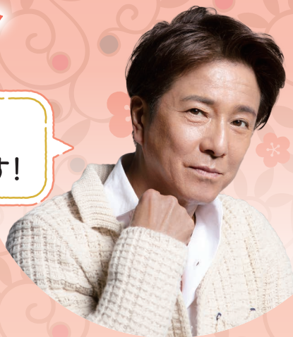
かわさき健幸福寿プロジェクト 応援サポーター 風間トオルさん